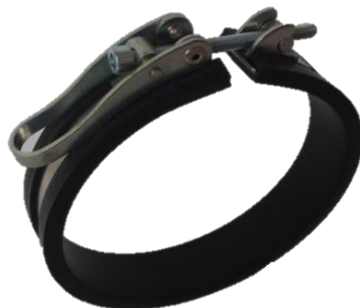
SVS 15, 20, 25 a 30 mm s rychlouzavěrem

Hadicová spona TORRO upravená pro použití na elastické průmyslové hadice z plastů (plyuretan, polyethylen, polyester aj.) vyztužené ocelovou spirálou.