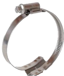
TORRO 9 a 12 mm na spirálové hadice

Hadicová spona TORRO upravená pro použití na elastické průmyslové hadice z plastů (plyuretan, polyethylen, polyester aj.) vyztužené ocelovou spirálou.