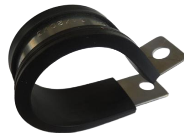
PŘÍCHYTKY alternativy k DIN 3016

Spojovací prvky pro oblasti, ve kterých je vyžadováno rychlé zavření a uvolnění spojení, jako např. filtrovací a plnicí zařízení nebo v potravním systému potravinářského průmyslu, který podléhá stálému čištění.